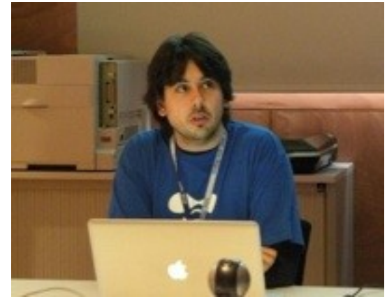
Pedro Cambra @pcambra